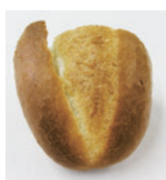
成形冷凍生地フランスパン(中) 左:パイルの上がり 右:内相の状態