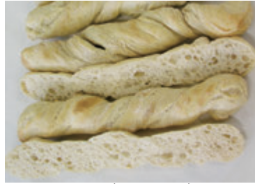
パーベイク プルツェルブロート 多加水 食事パンのパーベイクによる合理提供