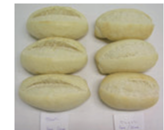
パーベイククリスピーロールの 成形条件の違いと最終形状