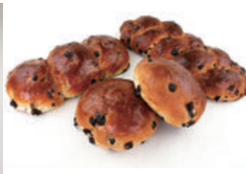
生地玉冷凍チョコブレッド