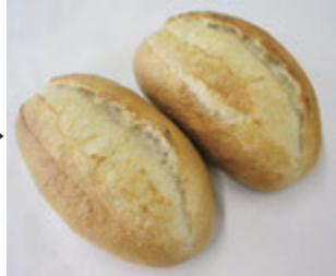
ホイロ後冷凍ヴァイツェンブロート