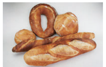
生地玉冷凍生地フランスパン(大) (発酵種併用による風味・食感の改善)