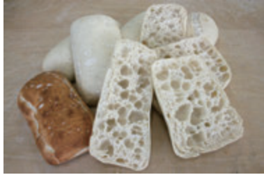
パーベイク チャバッタ