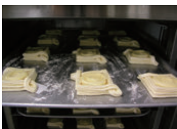
急速冷凍中のホイロ後冷凍デニッシュ ホイロ出し率は約80%で急速冷凍