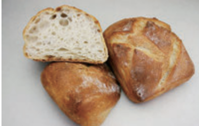
パーベイク リュスティック (フルベイク)