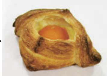
ホイロ後冷凍デニッシュ (冷凍保管約100日後)