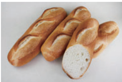
成形冷凍フランスパン(大) (発酵種併用による風味・食感の改善)