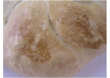
ホイロ後カイザー長期冷凍保管後の 表皮乾燥による”白焼け”現象