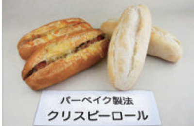
パーベイク製法 クリスピーロール 左:リベイク後 右:リベイク前