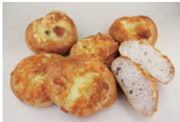
生地玉冷凍ポテトブレッド