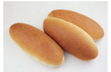
フラワーブルー法 成形冷凍焼き調理パン