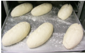
冷却過程のホイロ後冷凍生地 (ヴァイツェンブロート)