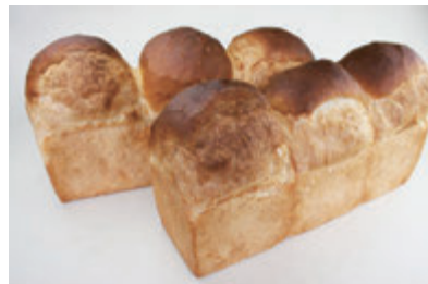
生地玉冷凍によるイギリスパン (発酵種併用による風味・食感の改善)