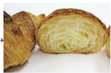
ホイロ後冷凍クロワッサン (冷凍保管約90日後)

お問い合わせ等は 03 - 3689 - 7571 日本パン技術研究所 伊賀まで