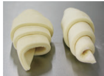
ホイロ後冷凍クロワッサン 成型方法と最終形状の比較 および改良剤スペックの違い