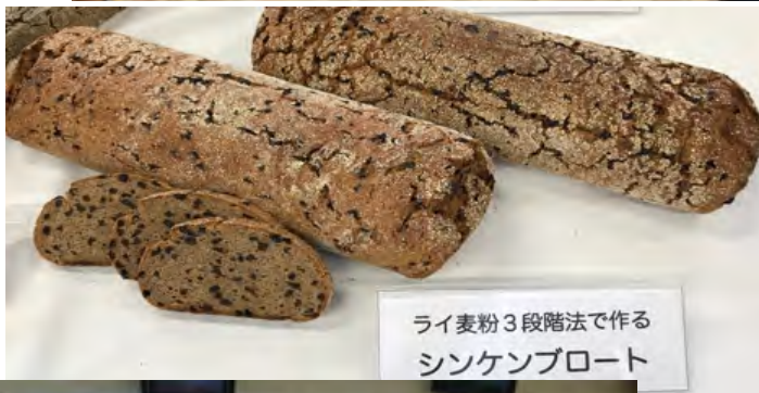
ライ麦粉3段階法で作る シンケンブロート