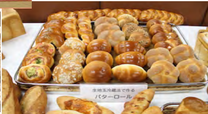
生地玉冷蔵法で作る バターロール